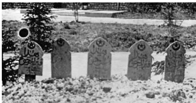
Tombes musulmanes à Notre-Dame-de-Lorette dans le Pas-de-Calais, en 1915

A gauche, les lettres du sigle UD de l'Union des Démocrates sont encerclées d'un ornement évoquant la stèle des tombes de ces soldats musulmans morts au combat et inhumés en France.